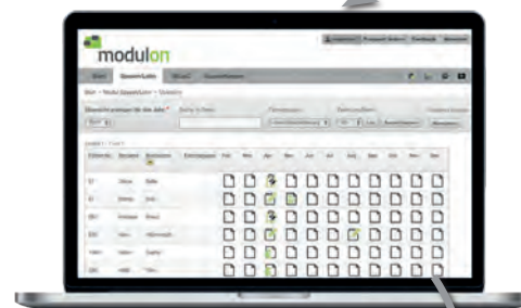
Ausgabe als PDF- / XLS-Datei