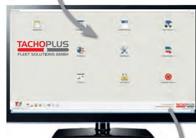
automatisierter Export Modulon Export